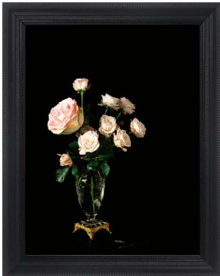
..... After Tchistovsky #3 Type tirage : Lambda - Type d'encadrement : Bois travaillé noir satiné Dimension du visuel : 65 x 40 cm Dimension oeuvre encadrée : 70 x 55 cm Poids oeuvre encadrée : 1,7 kg Valeur d'assurance : 500 euros TTC