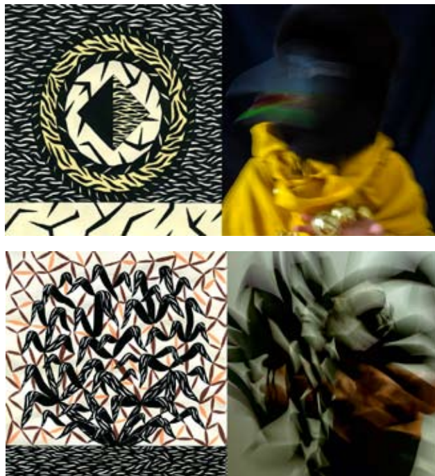
© Hector Olguin/ Karla Marie Bentzen / VOZ'Galerie

C'est à l'aide de crayons extrêmement fins que Karla esquisse d'abord chaque trait. Par la suite, elle utilise l'encre et la gouache pour révéler l'oeuvre finale. Elle travaille sur différents supports – dessins, papier peint, pochettes de disque, etc. – ce qui lui permet de s'autoriser plus de liberté: dans ses livrets elle s'amuse en réalisant des croquis vifs et spontanés, dans un style plus proche de la bande dessinée. Créative née, elle n'a jamais suivi de cours en école d'art. Le dessin a toujours fait partie de sa vie, comme un besoin authentique irréprensible, une façon de donner un sens à son univers et trouver sa place dans un monde chaotique.