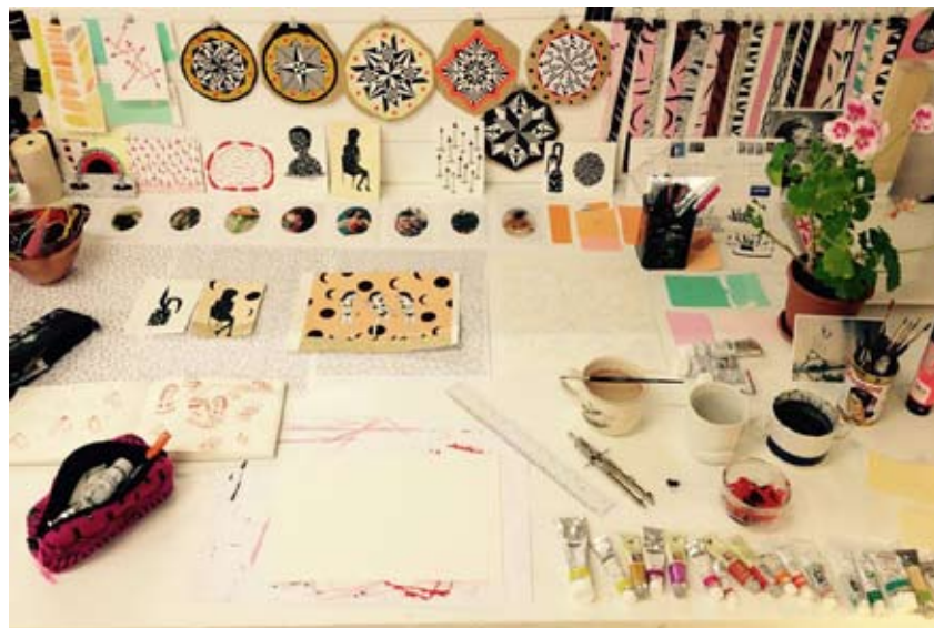
Son atelier