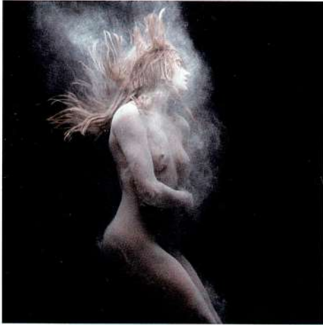
Dust 02