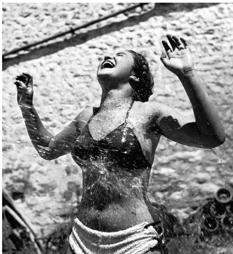
© Pierre JAMET, « Dina arrosée », 1937

Vernissage le jeudi 20 avril à partir de 19h30