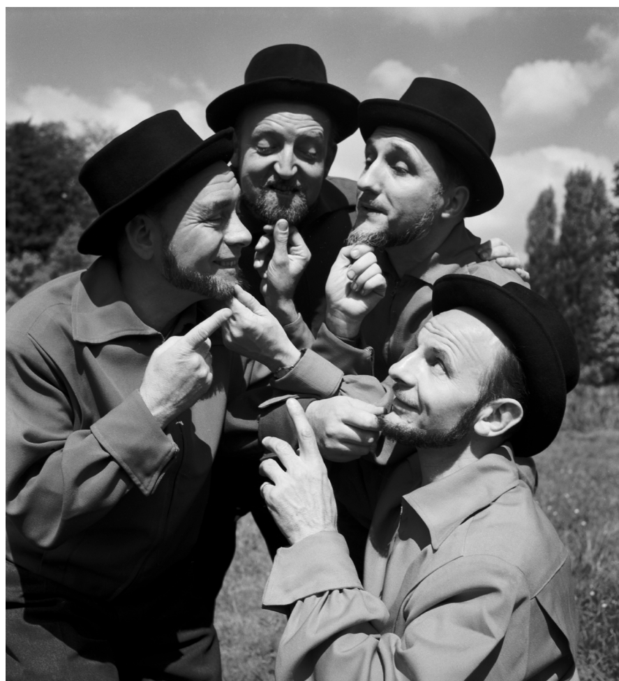
© « Les quatre barbus », années 1950, Pierre Jamet

Mobilisé en 1939, il doit mettre un terme à ses activités dans les auberges. En 1943, il entame une carrière de chanteur avec le groupe « Les Quatre Barbus » qui lui permettra de voyager autour du monde et de connaître un succès constant jusqu'aux années 70. Ne délaissant jamais la photographie, son travail se poursuit et s'enrichit des fréquents voyages et des nombreuses rencontres occasionnées par son activité musicale.